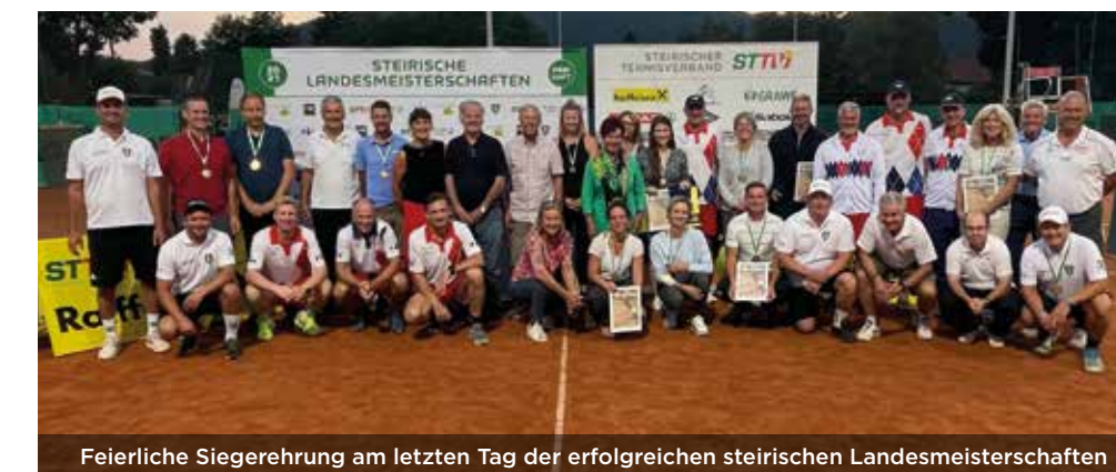
Feierliche Siegerehrung am letzten Tag der erfolgreichen steirischen Landesmeisterschaften