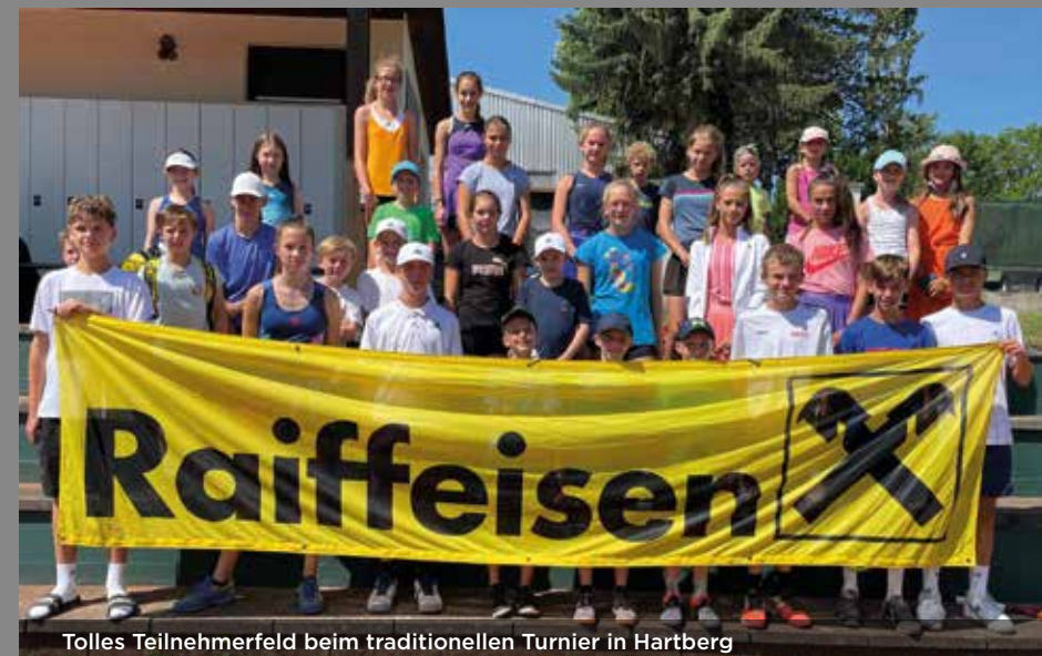
Tolles Teilnehmerfeld beim traditionellen Turnier in Hartberg