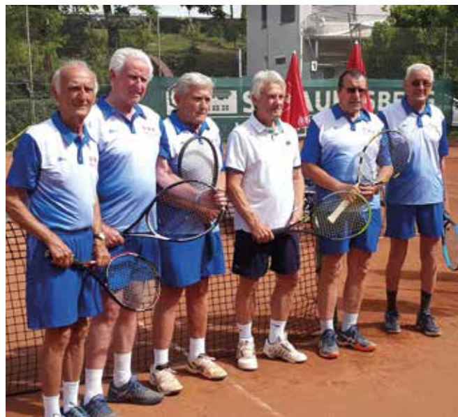
HERREN 80: Union Wirtschaftskammer Graz