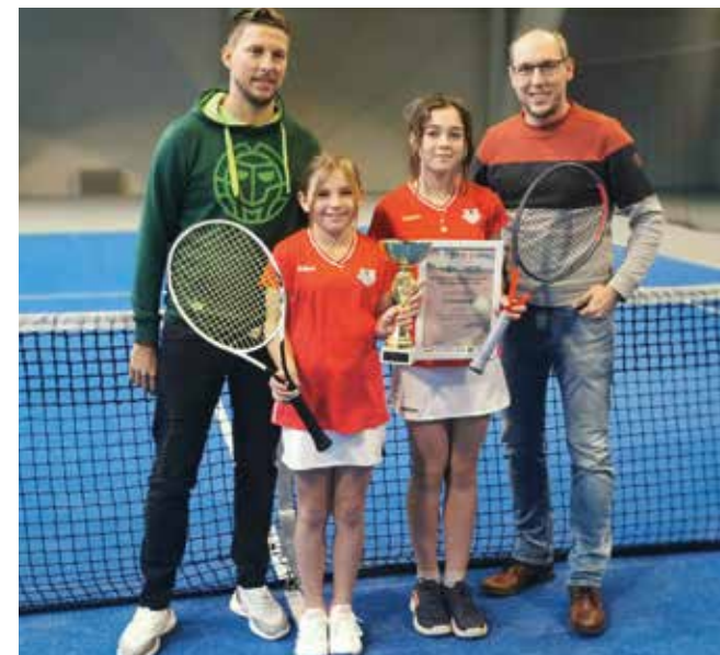
MÄDCHEN U11: TV Schwöbing