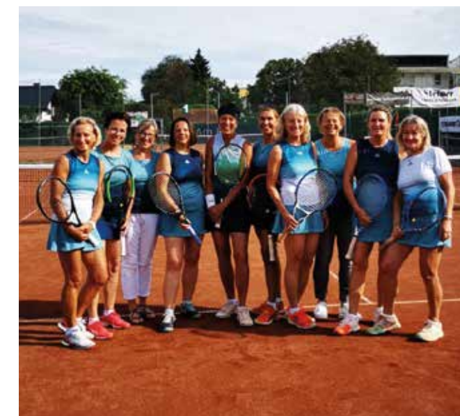
DAMEN 55: UTC Wildon