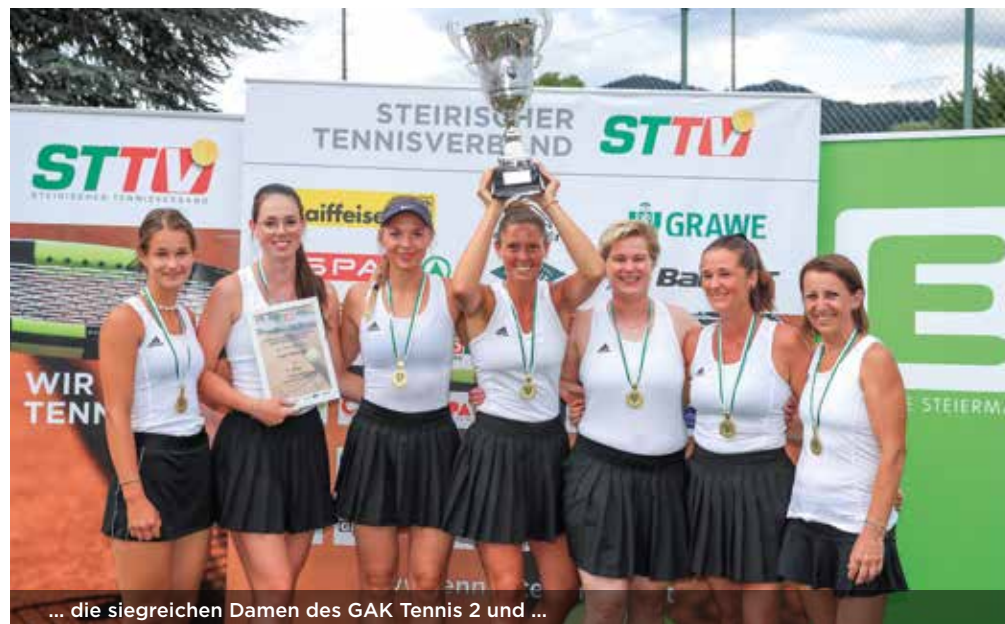
... die siegreichen Damen des GAK Tennis 2 und ...