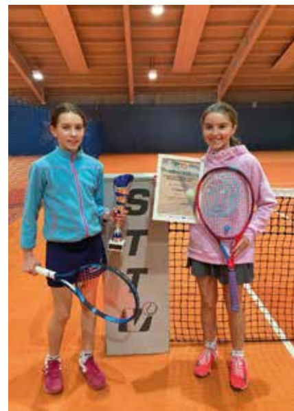
MÄDCHEN U13: TC Stainz