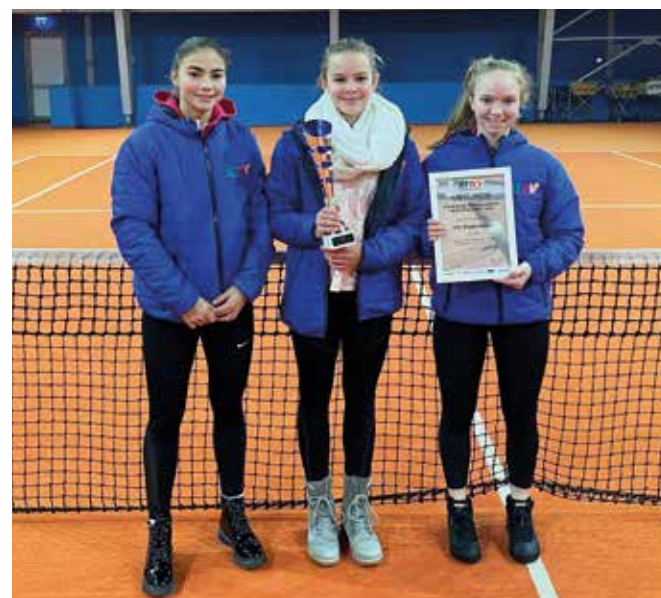
MÄDCHEN U15: UTC Riegersburg