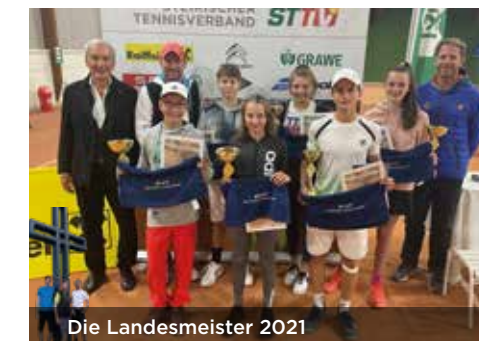
Die Landesmeister 2021

erfolgreich nachgeholt und abgeschlossen werden. „Ich gratuliere allen Landesmeisterinnen und Landesmeistern sehr herzlich. Der Turnier-Sommer war aufgrund der geschlossenen Tennishallen im Winter 2020/21 und dem daraus resultierenden dicht gedrängten Turnierkalender für alle Spielerinnen und Spieler sehr intensiv“, so STTV-Präsident Rudolf Steiner.