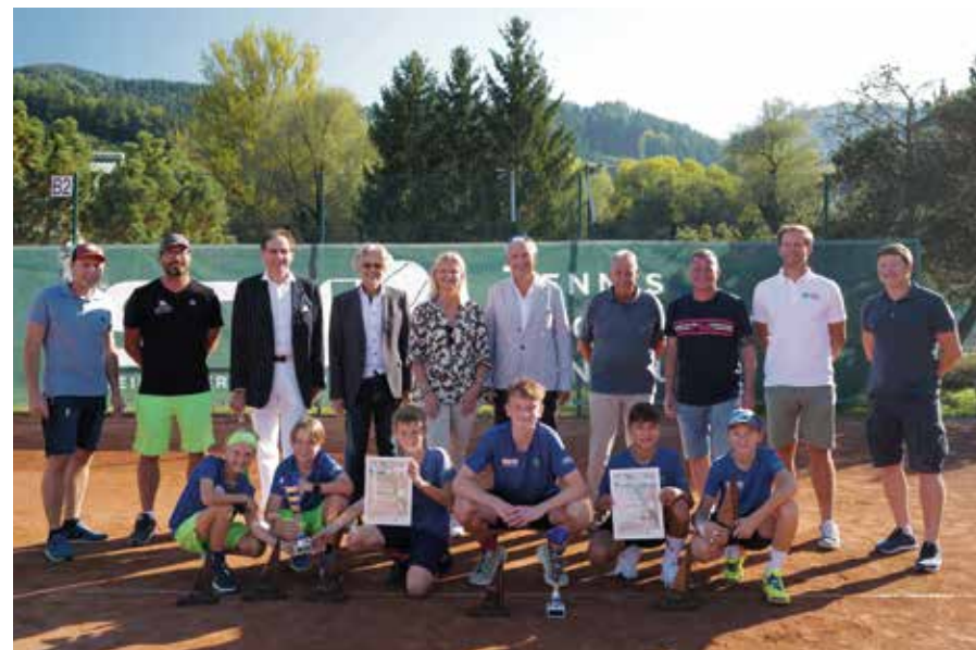
BURSCHEN U11 & BURSCHEN U13: ESV-Tennis Bruck/Mur