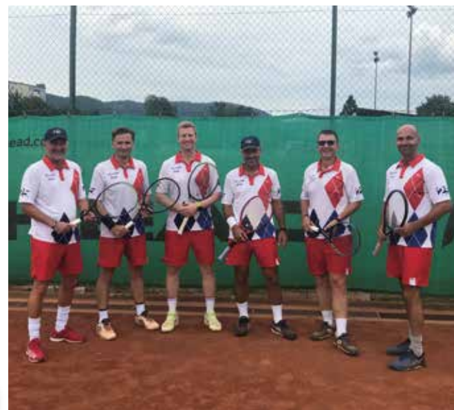
HERREN 45: TC LUV Graz