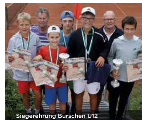
Siegerehrung Burschen U12