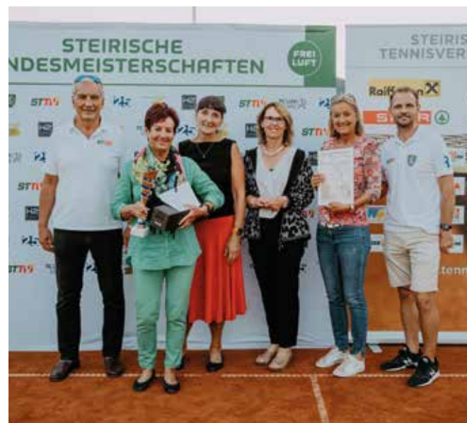
DAMEN 60: TC LUV Graz