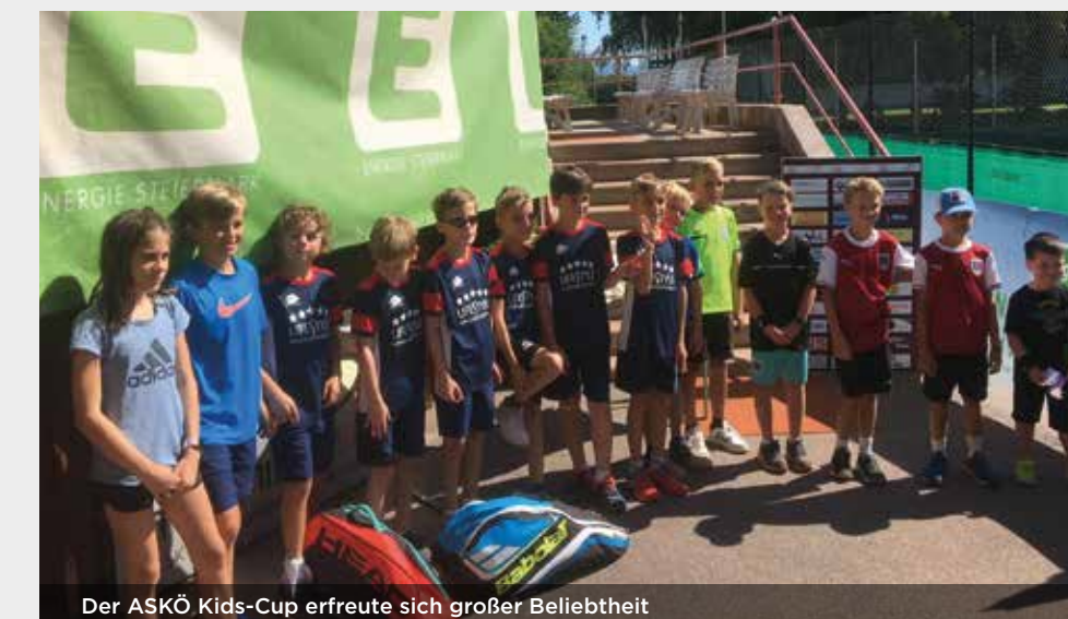
Der ASKÖ Kids-Cup erfreute sich großer Beliebtheit