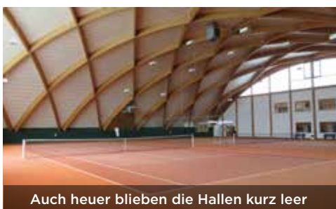
Auch heuer blieben die Hallen kurz leer

Mit knapp 300 Mannschaften in 41 Gruppen startete Ende Oktober die 20. Ausgabe der STTV-Wintermeisterschaft. Somit standen 900 Begegnungen in 39 steirischen Tennishallen auf dem Programm. Doch nach zwei Runden war aufgrund eines neu verhängten 4-wöchigen Lockdowns und der damit verbundenen Hallenschließungen der Spielbetrieb wieder unterbrochen. Mein großer DANK gilt allen Hallenbetreibern für die gute Zusammenarbeit. Wir können uns, gemessen an der Vielzahl an Hallen in der Steiermark, glücklich schätzen im Vergleich zu anderen Bundesländern", so Präsident Rudolf Steiner.