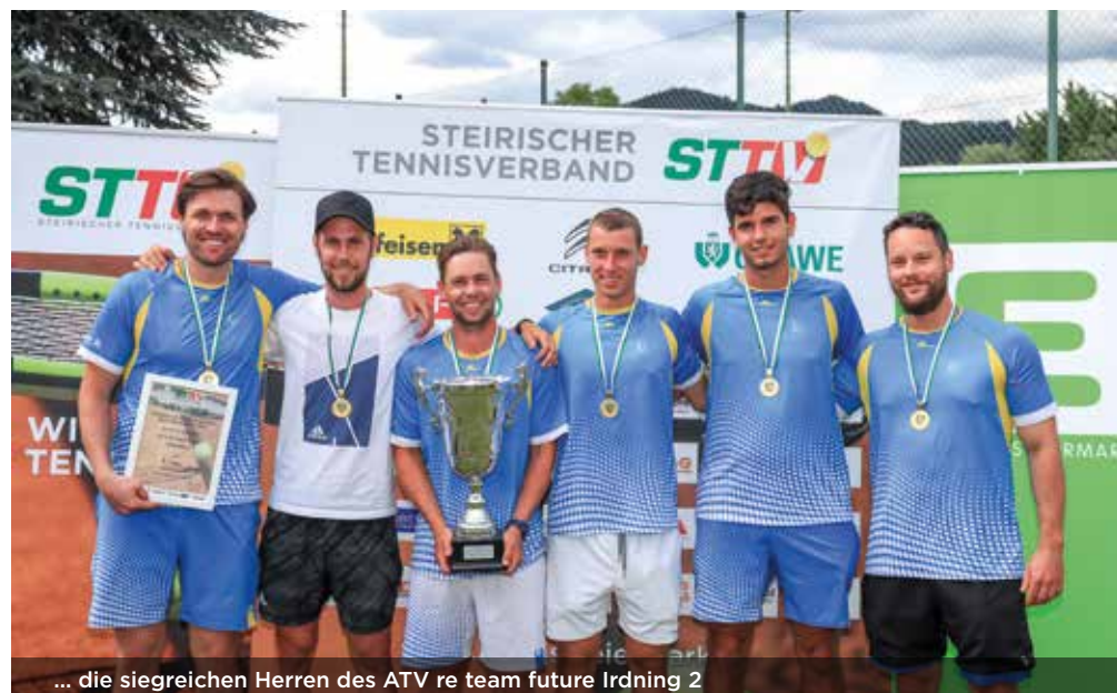
... die siegreichen Herren des ATV re team future Irdning 2