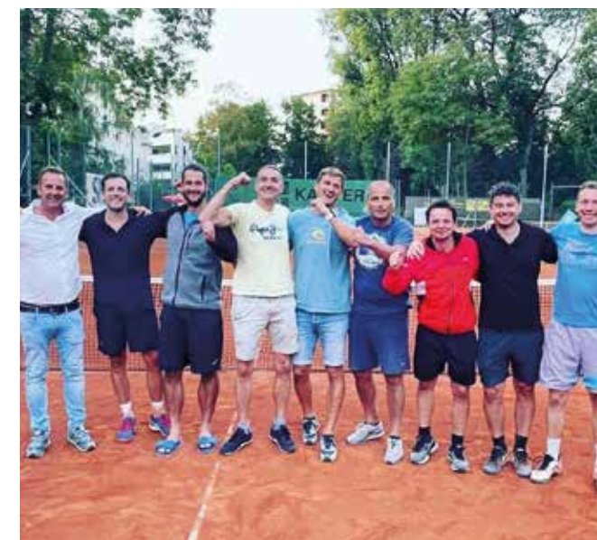
HERREN 35: Grazer Parkclub