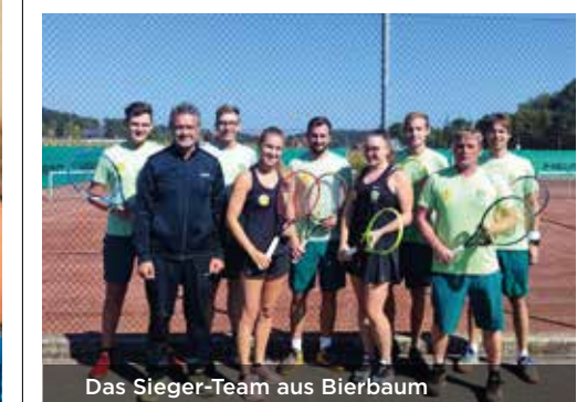
Das Sieger-Team aus Bierbaum

In der Gruppe B ließ das Mixed-Team vom TC Georgsberg über die gesamte Saison nichts anbrennen und lächelte nach sechs gespielten Runden mit 16,5 Punkten und somit einem 5-Punkte-Vorsprung auf TC Graz Waltendorf 2 vom Siegerpodest.