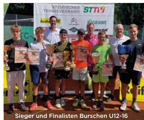
Sieger und Finalisten Burschen U12-16