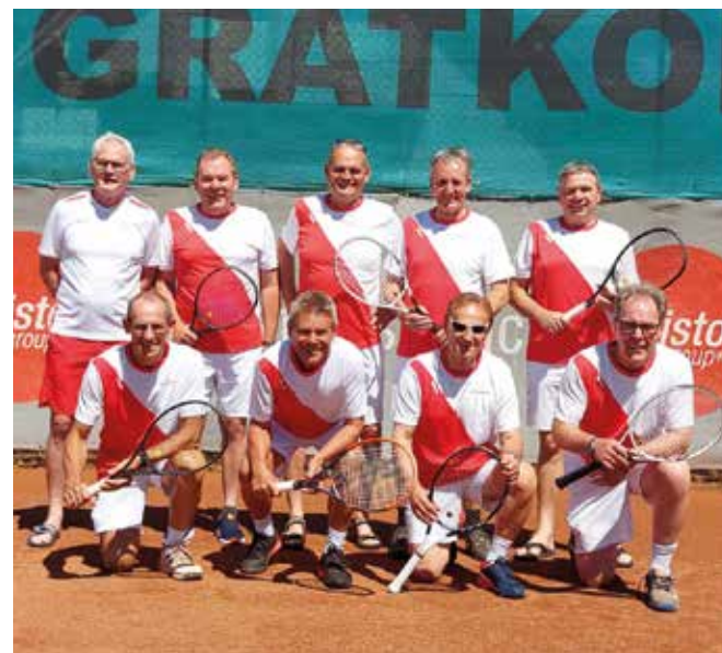
HERREN 60: TK Gratkorn