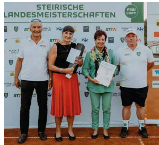
DAMEN 65: TC LUV Graz