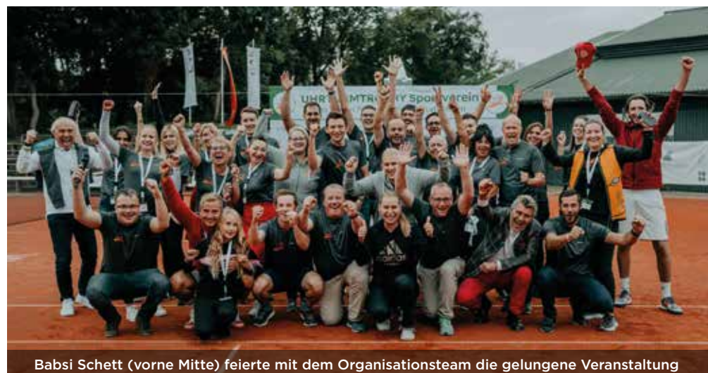
Babsi Schett (vorne Mitte) feierte mit dem Organisationsteam die gelungene Veranstaltung