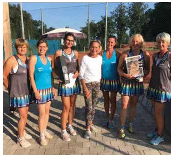
DAMEN 35: TV Sparkasse St.Stefan/Stainz