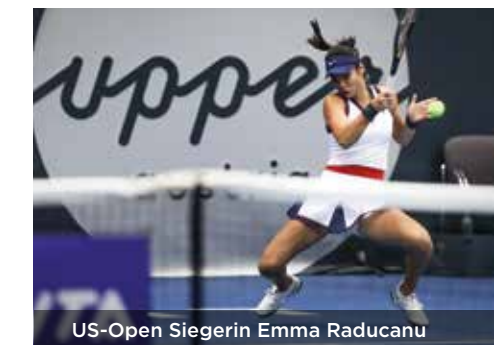
US-Open Siegerin Emma Raducanu