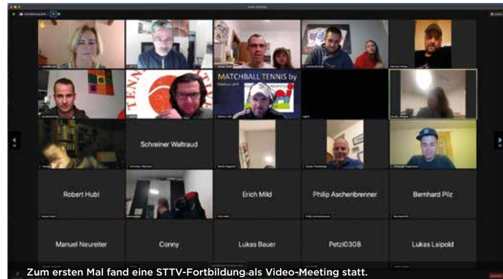
Zum ersten Mal fand eine STTV-Fortbildung als Video-Meeting statt.