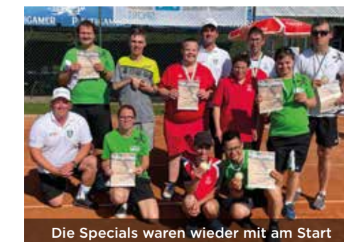
Die Specials waren wieder mit am Start