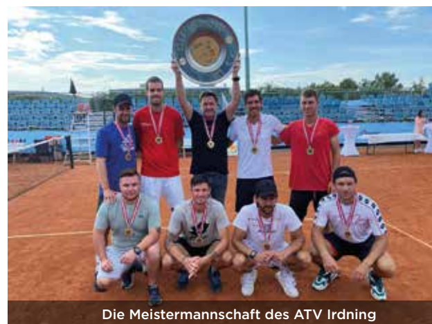
Die Meistermannschaft des ATV Irdning