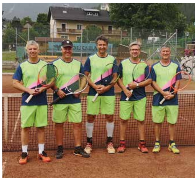
HERREN 55: SG P2-Tenniscenter/TC Tivoli Naturfreunde Leoben