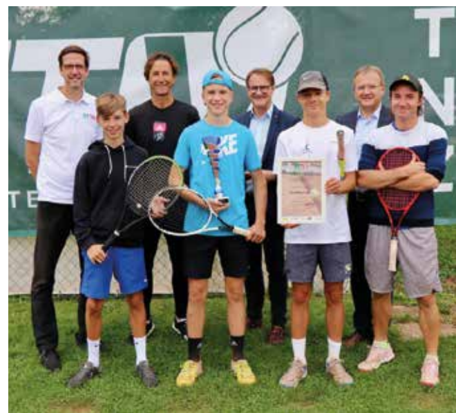
BURSCHEN U15: TSV Hartberg-Tennis