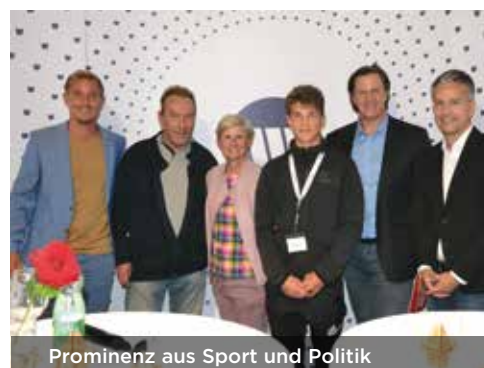
Prominenz aus Sport und Politik