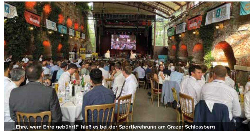
„Ehre, wem Ehre gebührt!“ hieß es bei der Sportlerehrung am Grazer Schlossberg