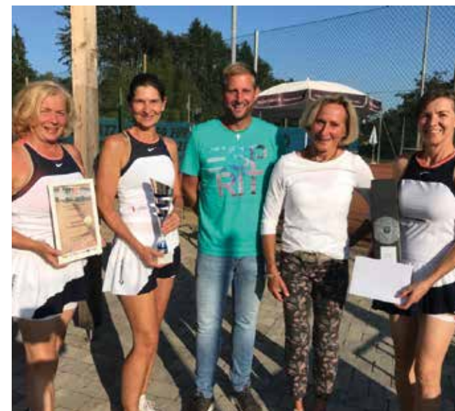
DAMEN 45: TV Sparkasse St.Stefan/Stainz