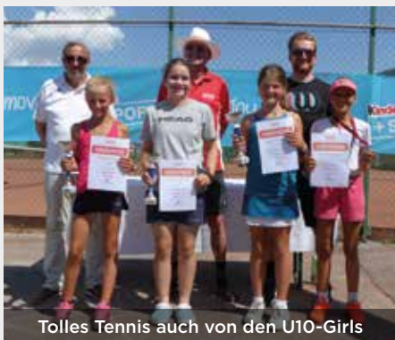
Tolles Tennis auch von den U10-Girls