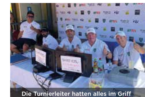
Die Turnierleiter hatten alles im Griff