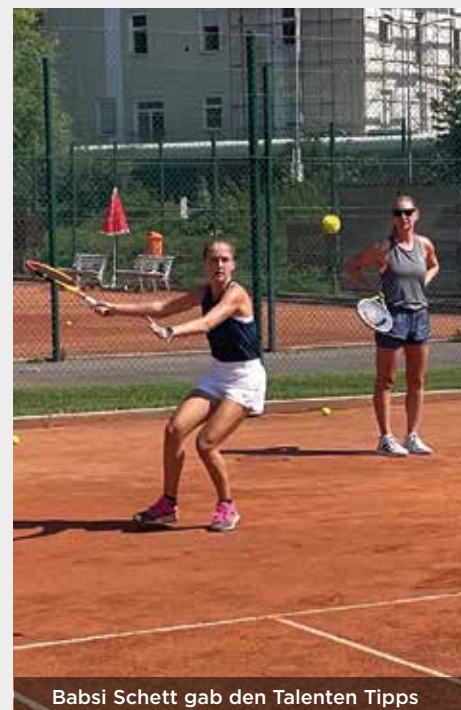
Babsi Schett gab den Talenten Tipps