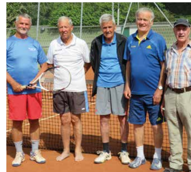
HERREN 75: TC LUV Graz