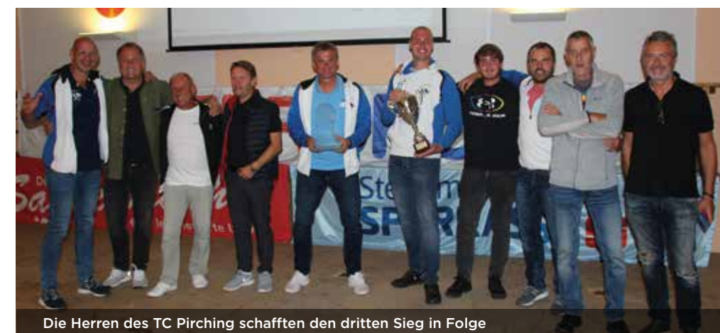
Die Herren des TC Pirching schafften den dritten Sieg in Folge

DIE WEITEREN GRUPPENSIEGER 2021: Challenge: UTC Sparkasse Gnas 1, UTC Allerheiligen 1. Future: UTC Raiba Hatzen-dorf 1, TC Feldbach 1, TC Union Schwabau 2. Starter: TC Gsöls Kirchberg 1, Tennis Club St. Ulrich 1, USV Obergnas 2, ATV Loipersdorf 1, UTC Hatzendorf 3 (Damen)