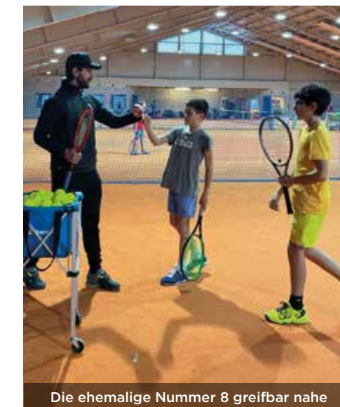
Die ehemalige Nummer 8 greifbar nahe