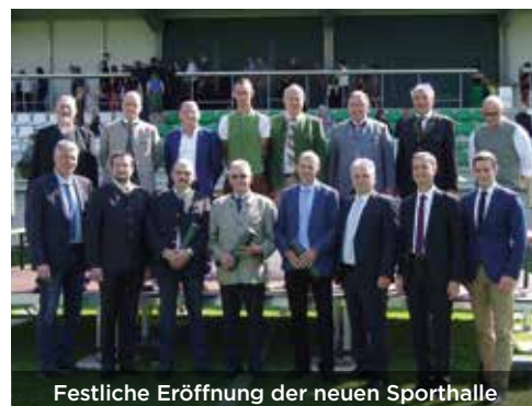
Festliche Eröffnung der neuen Sporthalle

Mit einem dreitägigen Mix an Sport und Unterhaltung wurde das neue Sport- und Freizeitzentrum in Friedberg offiziell seiner Bestimmung übergeben.