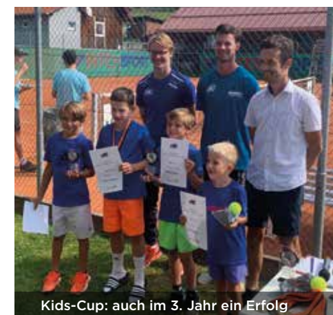
Kids-Cup: auch im 3. Jahr ein Erfolg