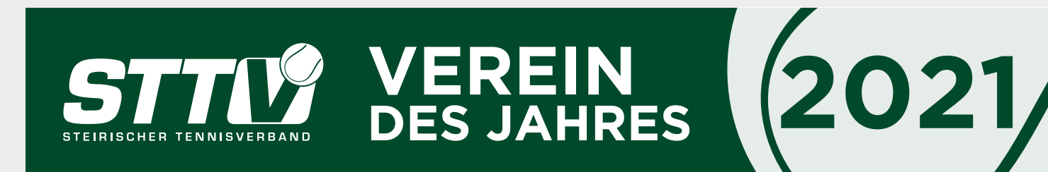
Diese Plane wird die Anlage des TC Judendorf-Straßengel als „Verein des Jahres“ zieren.