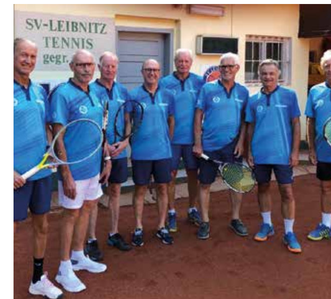
HERREN 65: SV Leibnitz