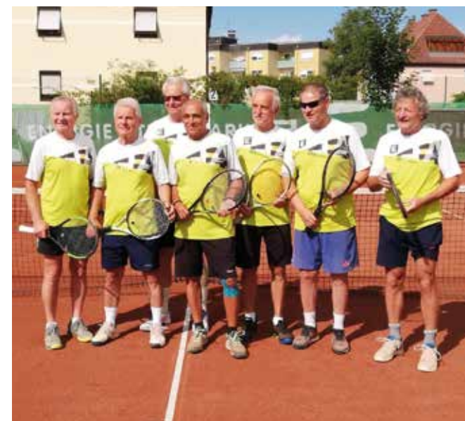
HERREN 70: ESV Knittelfeld