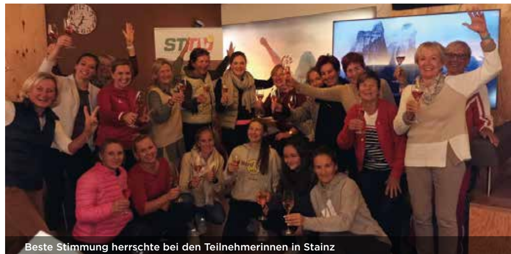
Beste Stimmung herrschte bei den Teilnehmerinnen in Stainz