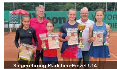
Siegerehrung Mädchen-Einzel U14